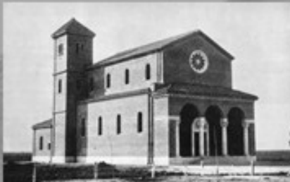
3- Borgo Bainsizza