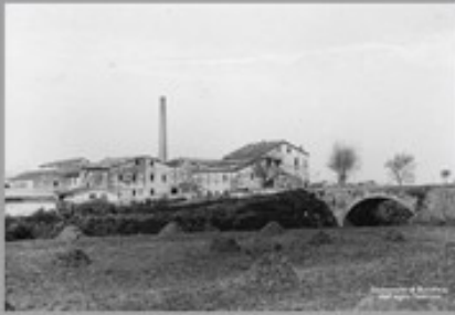
1-Borgo Le Ferriere già Ferriere di Conca