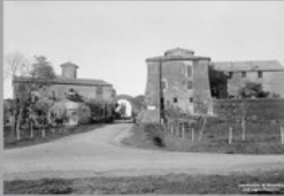
2- Borgo Montello già Casale di Conca