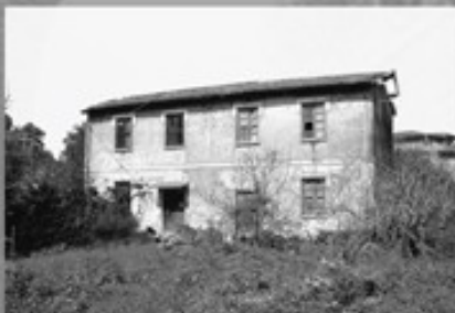
4- Borgo Santa Maria