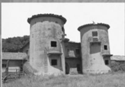
5- Borgo dell'Acciarella